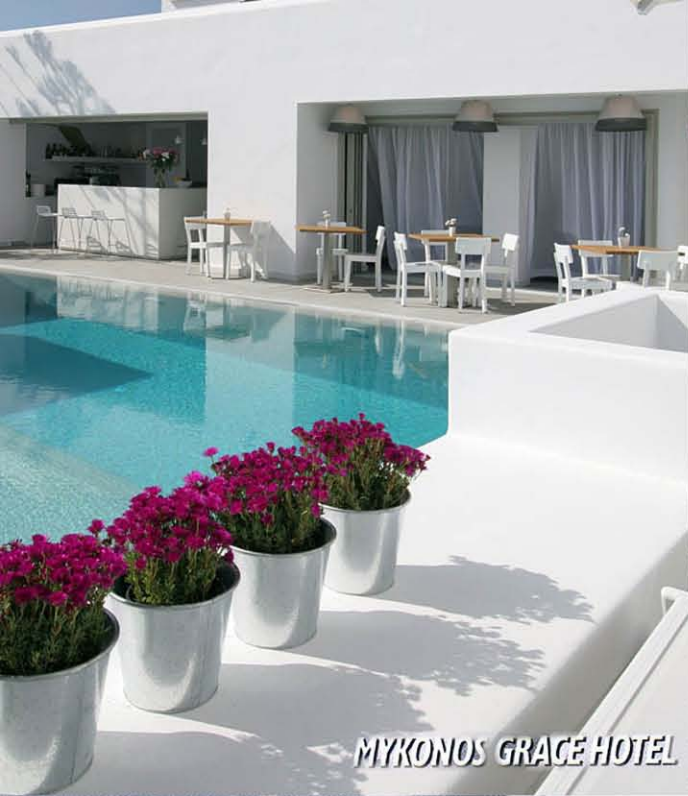
MYKONOS GRACE HOTEL