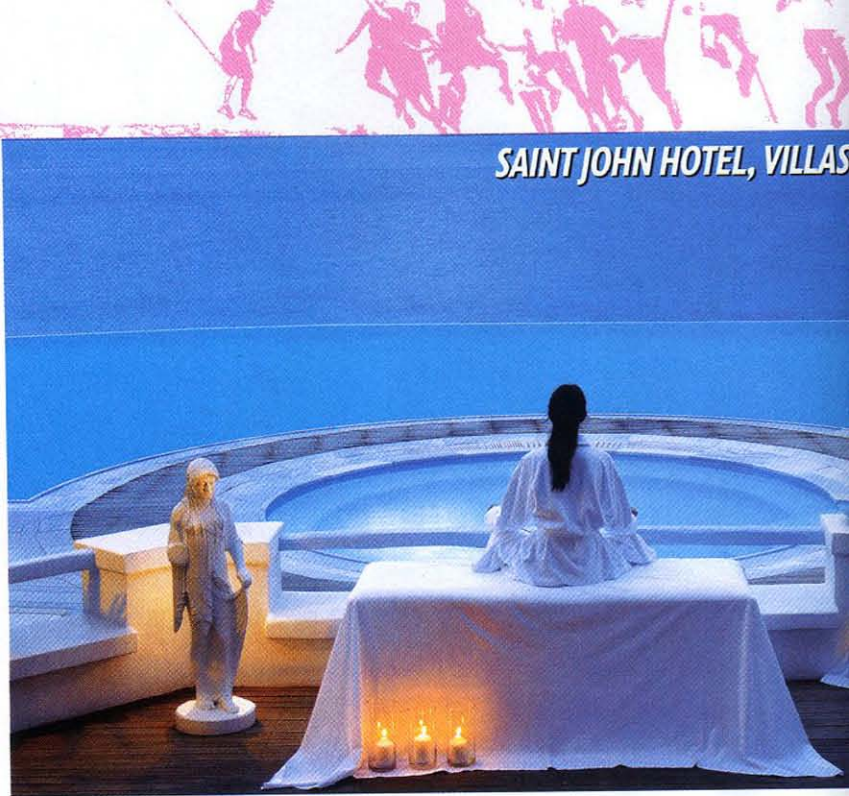
SAINT JOHN HOTEL, VILLAS